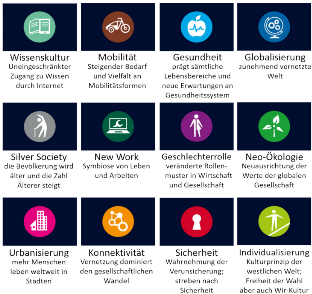
Abbildung 1: Die zwölf Megatrends in vereinfachter Darstellung (Zukunftsinstitut 2023)

Tatsächlich haben alle diese 12 Megatrends eine Bedeutung auch für die Mainzer Wirtschaft, also auch für die Arbeit der Abteilung Wirtschaftsförderung. Im Beratungsalltag und in der Netzwerkarbeit tauchen sie vielgestaltig auf – etwa als demografischer Wandel, digitale Transformation, Finanzierung von neuen Prozessen (oftmals zum Thema Nachhaltigkeit) oder auch New Work mit neuen Ansprüchen bspw. an Räumlichkeiten.