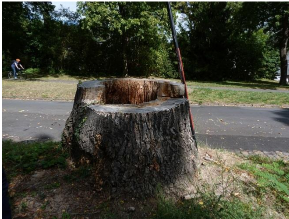
Abb. 3: Gefällter Baum Nr. 14320 mit Höhle im Wurzelbereich