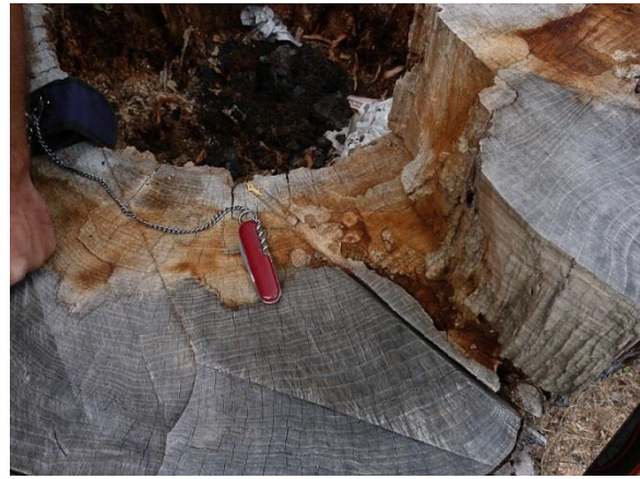
Abb. 4: Gefällter Baum Nr. 14320; neben dem Taschenmesser sind runde Käferpuppenwiegen zu sehen.