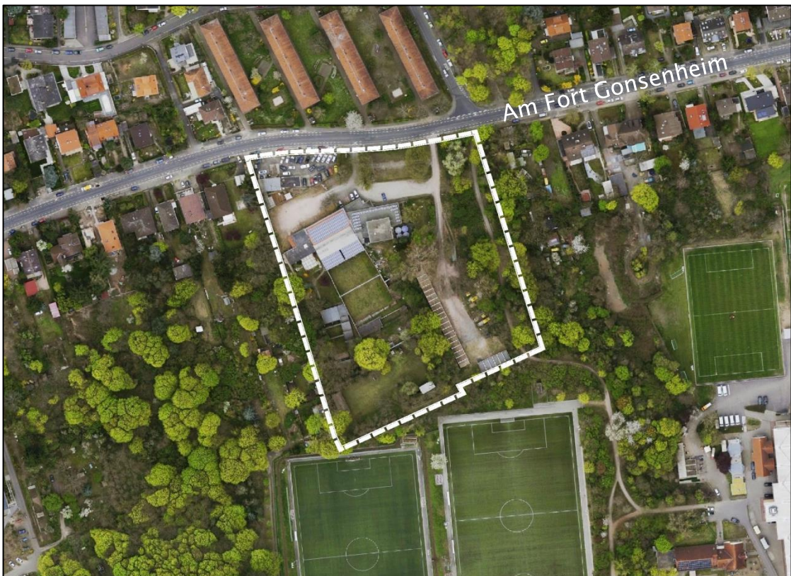
Abb. 1: Lage des Plangebietes – Luftbild (ohne Maßstab)

Den Eingriffen des Bebauungsplanes werden zudem folgende Flächen zugeordnet, die ebenfalls Bestandteil des Geltungsbereiches sind: